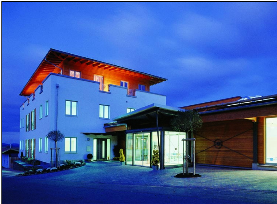
Verwaltungsgebäude MENZ HOLZ GmbH & Co. KG