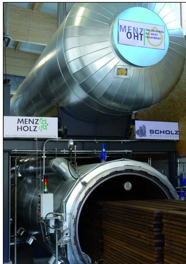
MENZ OHT - Anlage